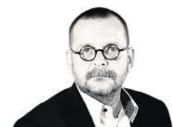
Von Christoph Oppermann

Komische Kunst hat nicht nur etwas ungemein Unterhaltendes, sondern auch das Privileg, Wahrheiten auf den Punkt äußern zu dürfen. Man kann's zur Not immer noch unter „Satire“ verbuchen.