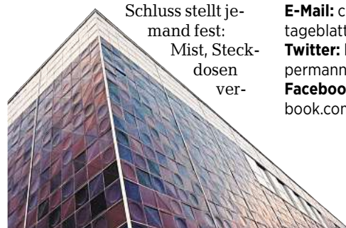
Der „Kachelofen“ am Göttinger Albaniplatz.

Info Sie erreichen den Autor unter E-Mail: c.oppermann@goettinger-tageblatt.de